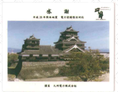
▲九州電力株式会社からの寄贈品