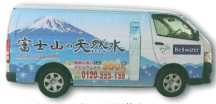
▲ベルウォーター富士山の天然水