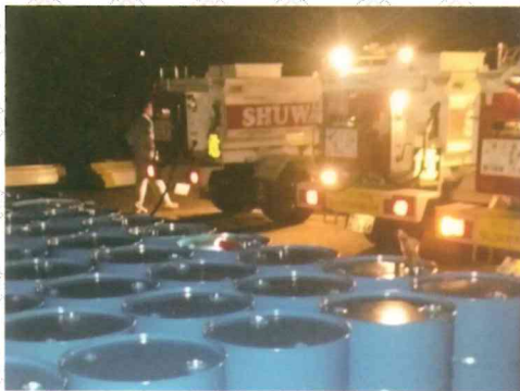
▲九州電力の要請により熊本県阿蘇市内牧にて給油支援