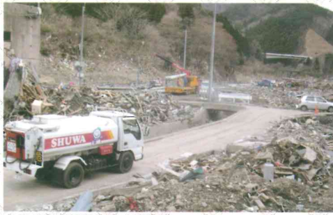
▲岩手県復興釜石市支援活動