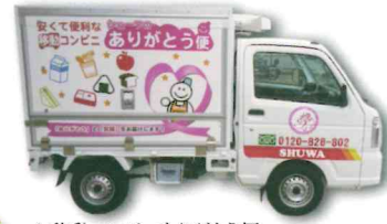
▲移動コンビニありがとう便