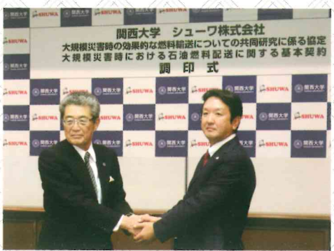
▲(右)弊社矢野社長と(左)関西大学池内理事長 調印式の様子

全国対応可能!! エアコンクリーニング エアコンメンテナンス 新設・入替・電気工事