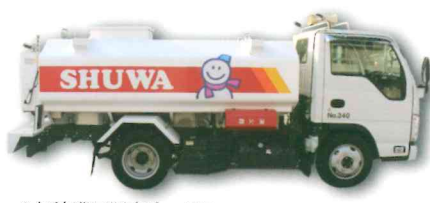
▲灯油巡回販売サービス